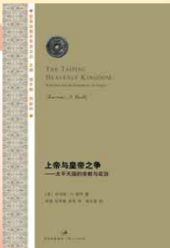
出版：上海人民出版社 定价：35 元

该书是西方学者研究太平天国运动及宗教信仰的一大力作！在理解皇帝的体制、形象及相关问题上，在构想现代宗教、文化和政治秩序上，太平天国做出了重大的贡献。