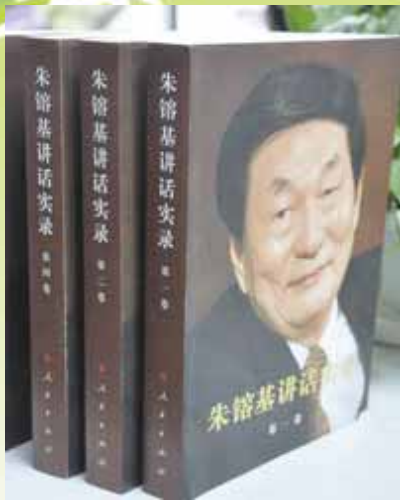
作者：朱镕基 出版：人民出版社

篇幅： 共四卷，收入了朱镕基担任国务院副总理、国务院总理期间的重要讲话、谈话、文章、信件、批语等 348 篇，照片 272 幅，批语、书信及题词影印件 30 件。