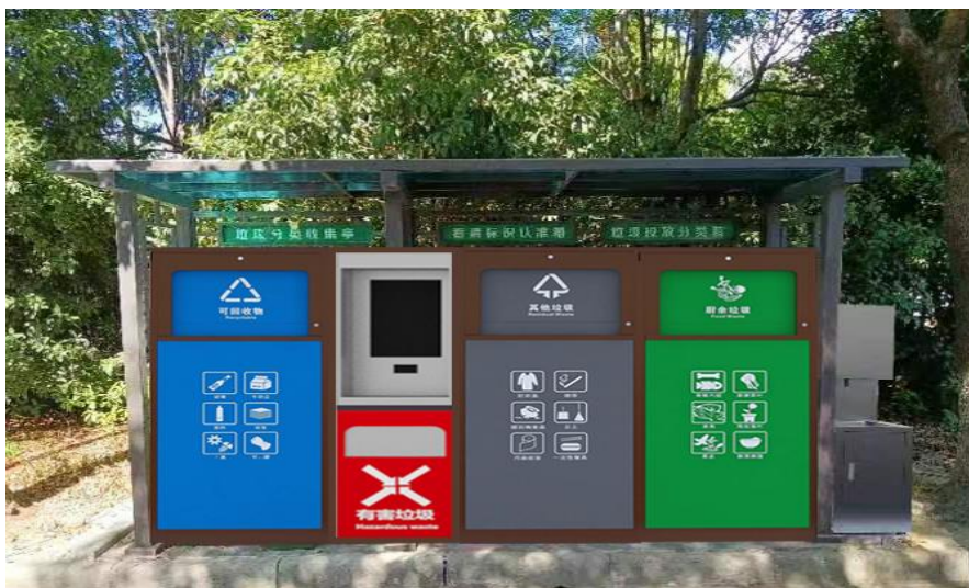
(四投口智能分类箱示意图)

(参考图样，具体以采购人或考核要求的为准，因地制宜，根据场地布置的实际情况，可拆分布置)