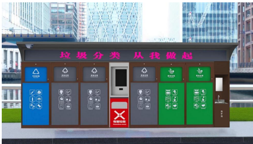
(6 投口智能垃圾分类箱参考图样)

(参考图样，具体以采购人或考核要求的为准，因地制宜，根据场地布置的实际情况，可拆分布置)