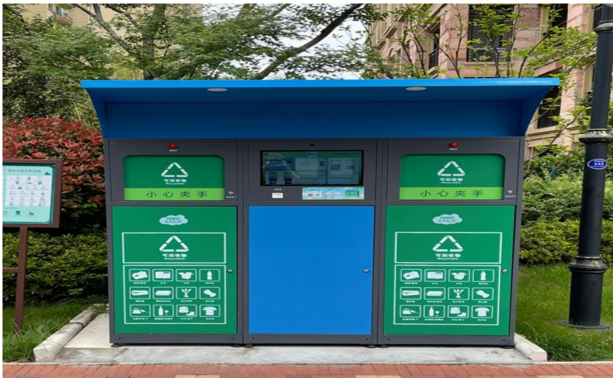
(智能可回收箱示意图)

(参考图样，具体以采购人或考核要求的为准，因地制宜，根据场地布置的实际情况，可拆分布置)