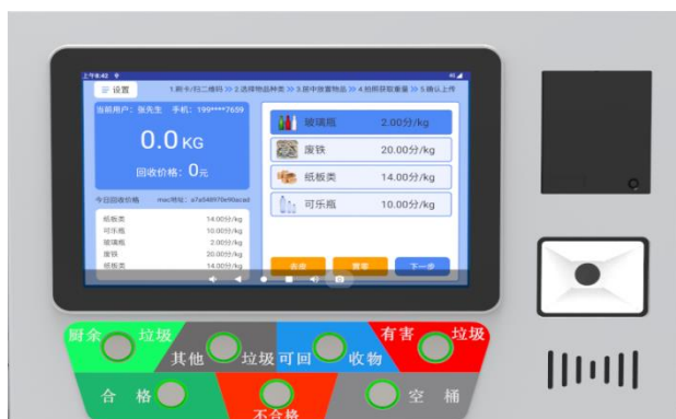
(清洁屋称重系统控制终端示意图)

(参考图样，具体以采购人或考核要求的为准，因地制宜，根据场地布置的实际情况，可拆分布置)