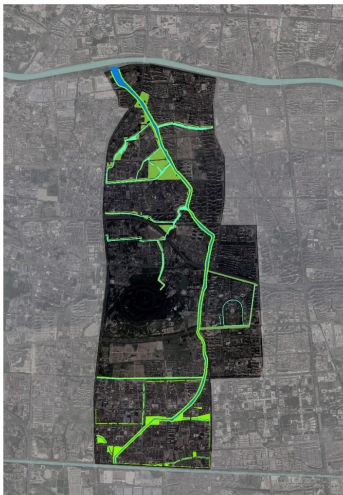
图 1 (确切范围以甲方提供的 CAD 范围图为准)

项目研究范围结合实际规划、文旅研究等工作需要，除下图所示淹城中路和武宜中路之间的重点区域外，按需扩展到其他相关区域。