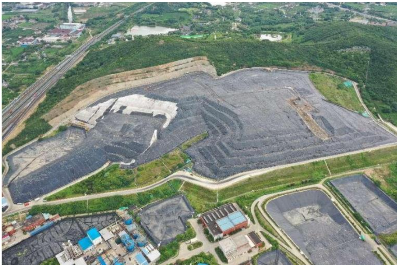
图 1.3 现场照片（2022 年 8 月）