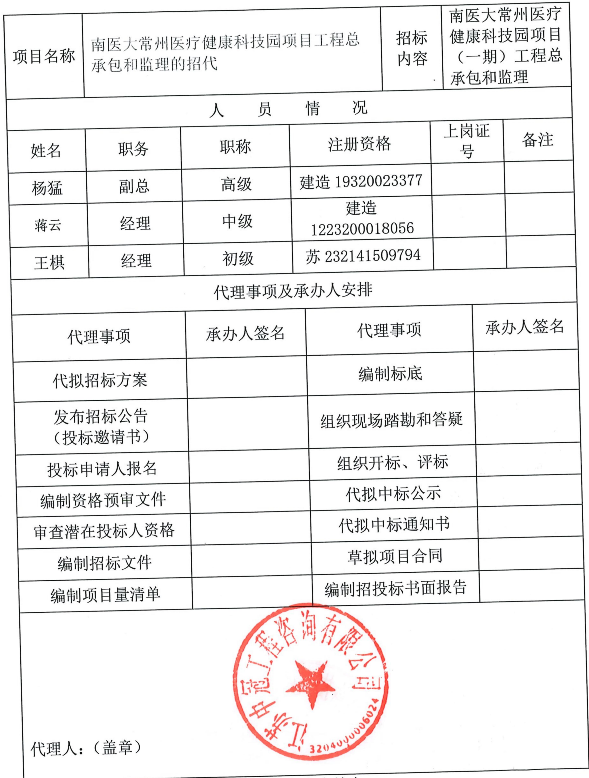
项目代理项目组组成人员情况及事项表