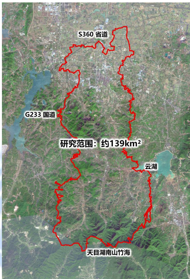
镇域发展战略研究范围