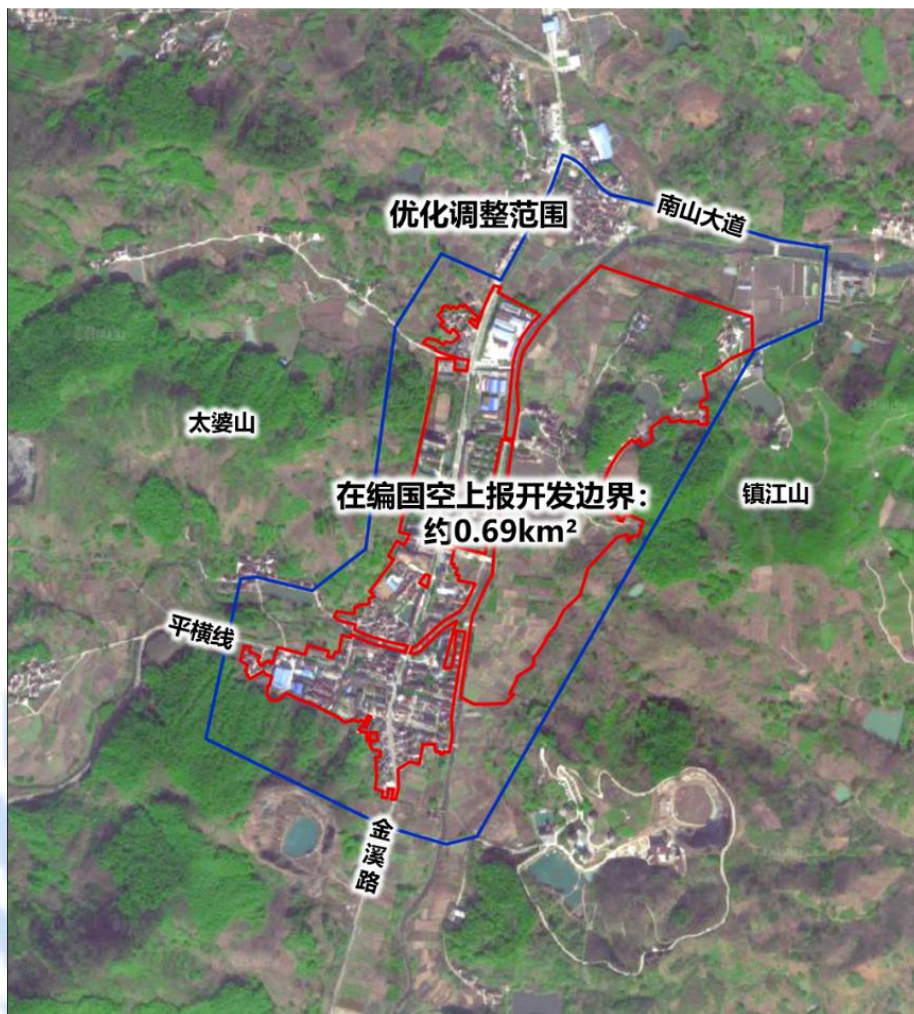
在编国土空间规划上报的横涧镇区范围