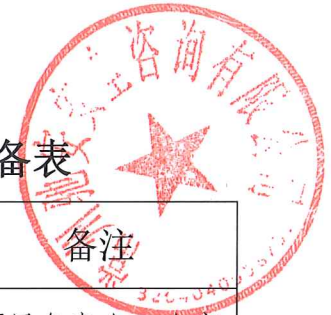
中标单位使用专家及人员配备情况报备表