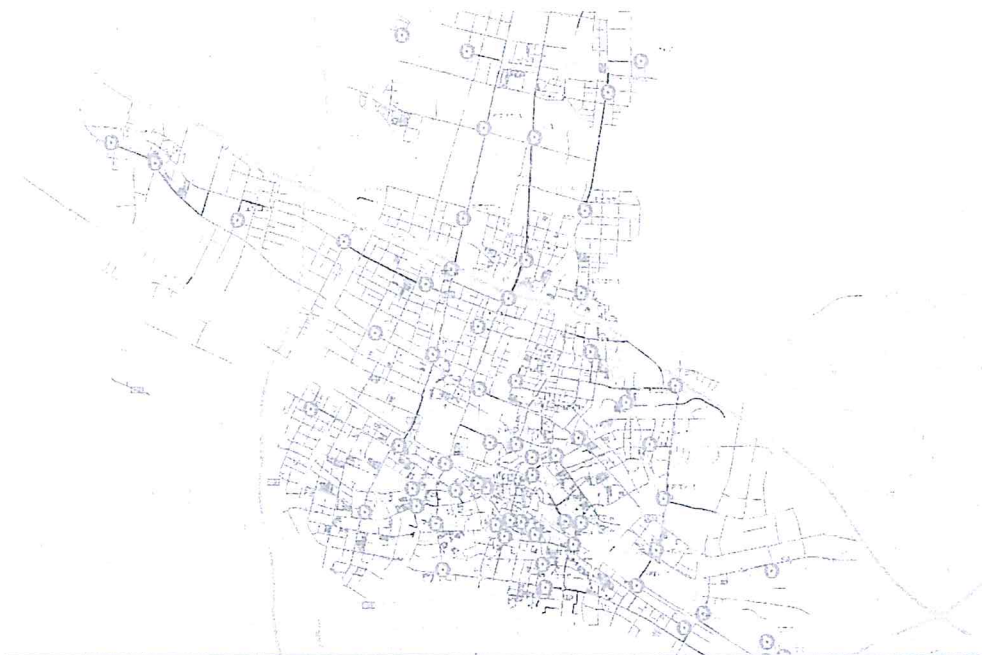
常州市城市排水有限公司排水设施分布图（绿色部分）

污水设施分布在天宁区、钟楼区和新北区，中水设施分布在新北区。详细设施信息见 GIS 系统。