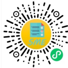
中小企业规模类型自测小程序

申明：测试结果是依据测试者提供的所属行业和有关指标数据生成，其信息真实性由测试者负责。