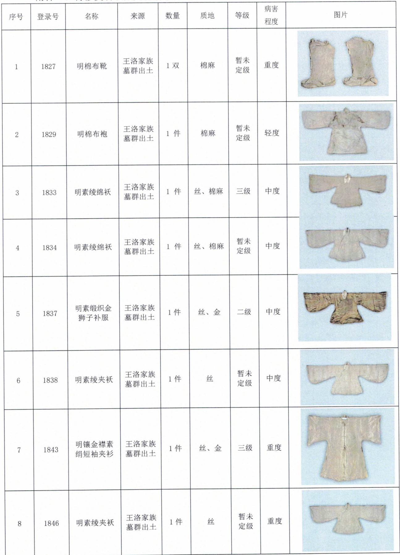
附件一：待修复纺织品文物清单