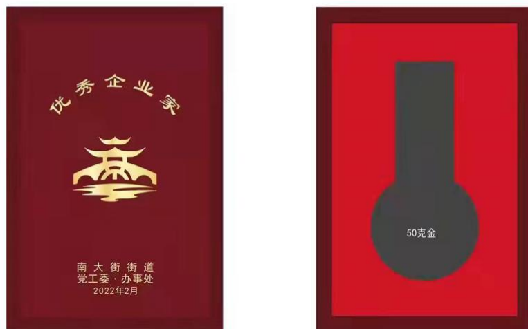
尺寸：140X200mm 仿红木色木盒，盒面上印金色 枣红色天地盖纸盒不烫字色