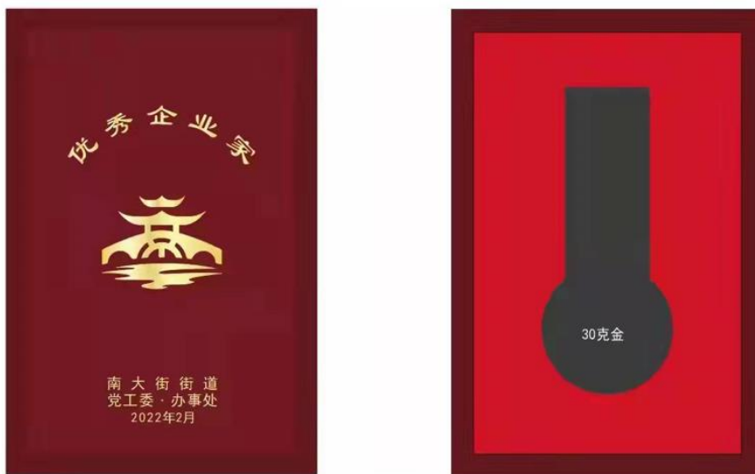
尺寸：100X150mm 仿红木色木盒，盒面上印金色 枣红色天地盖纸盒不烫字