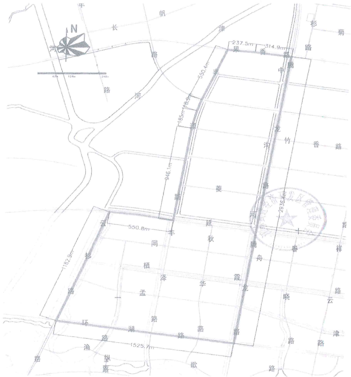
图例： 区域范围控制线 控制线长度标注 河道 道路