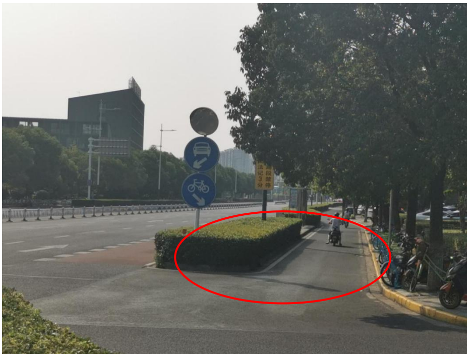
图 1-2 监控飞龙东路通江南路西北角过往行人与车辆