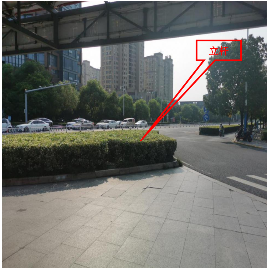
图 1-1 监控杆位置