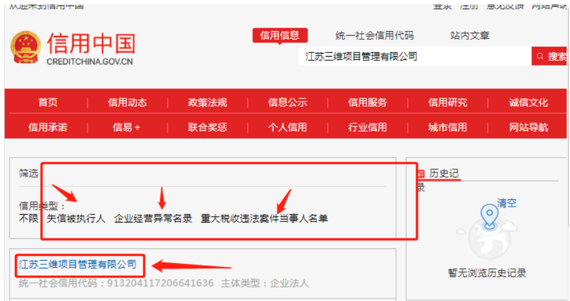
图 1（失信被执行人范本）