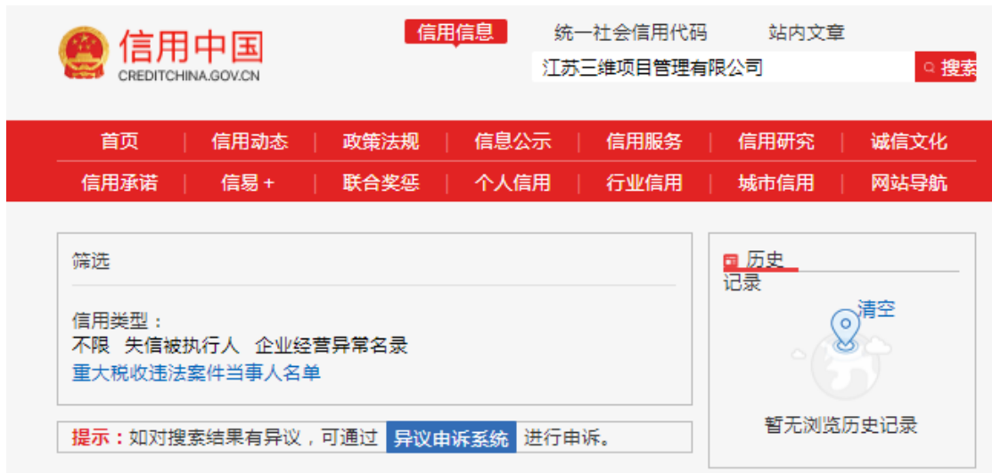
图 4（相关基本信息范本）