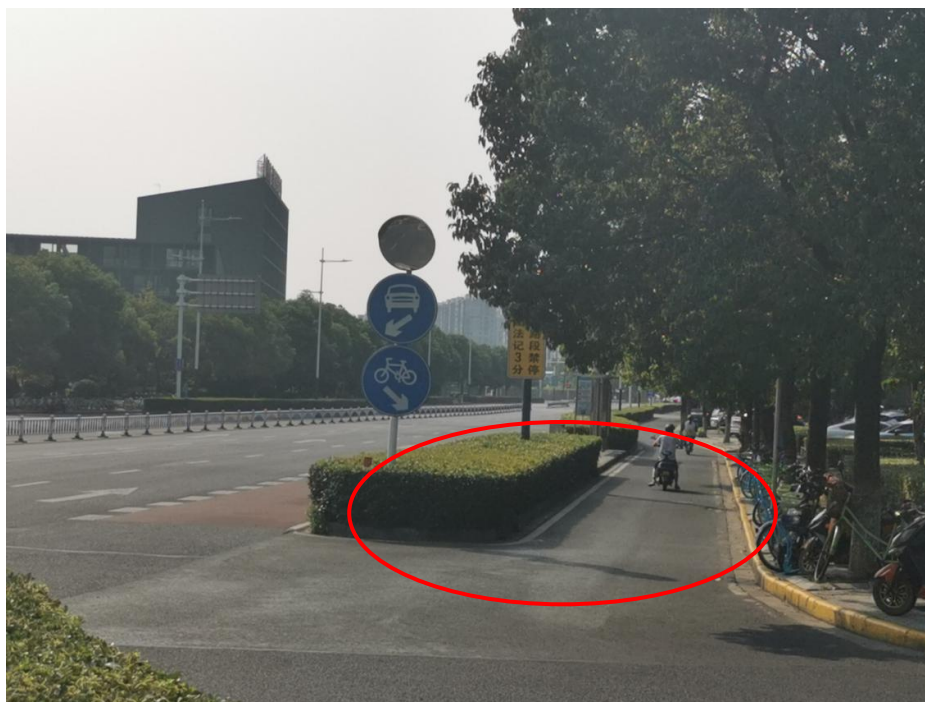
图 1-2 监控飞龙东路通江南路西北角过往行人与车辆