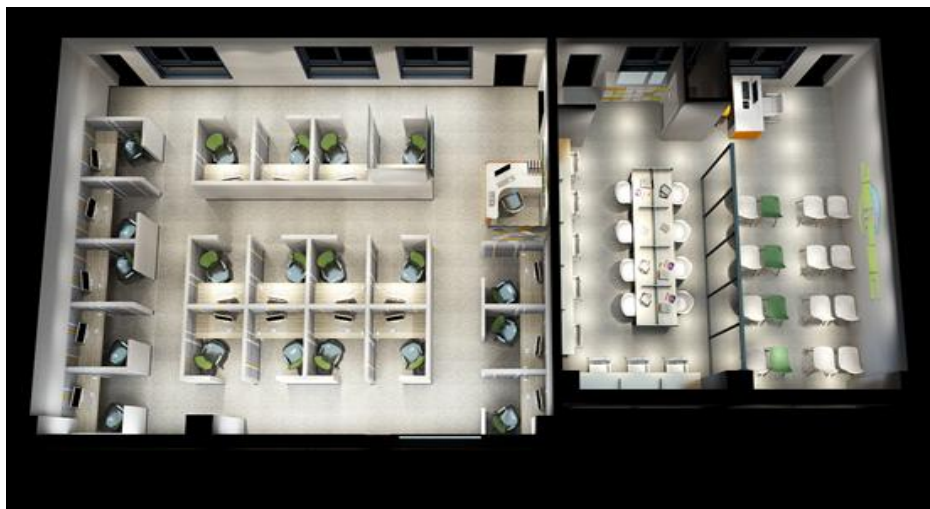
平面鸟瞰图（参考图）

20 间测试间还具备教师发展中心课程录制功能，灯光、背景、吸音、视频采集、电脑编辑符合录播要求。