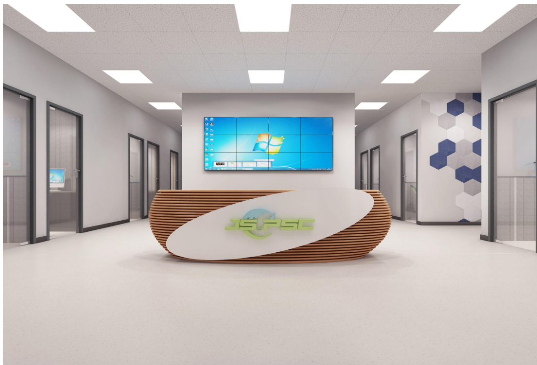
教师发展中心效果图（参考图）