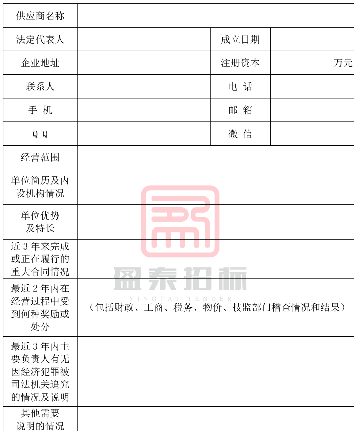
供 应 商 情 况 表