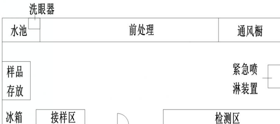
图 2. 农贸零售市场快检实验室布局参考图