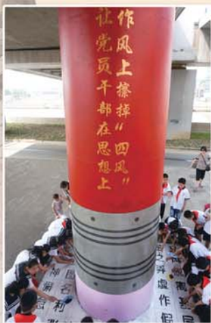
● 组织社区党员、群众开展巨型橡皮擦“四风”活动，营造良好社会氛围