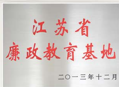
● 2013年12月，勤廉导师工作室被评为“江苏省廉政教育基地”