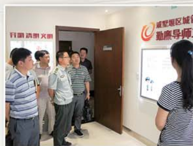
● 区城管局开展“中国梦、城管梦”勤廉主题教育活动