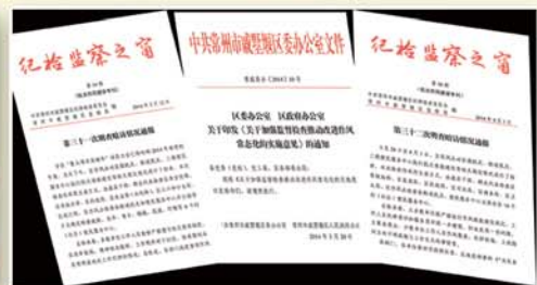
● 监督执纪问责，坚决纠正“四风”