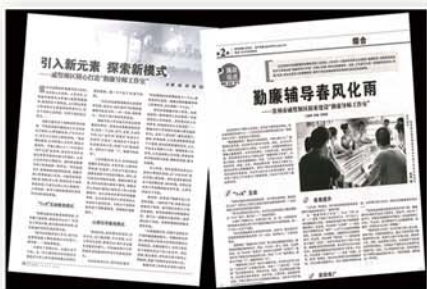
● 《中国纪检监察报》、《党的生活》大篇幅介绍勤廉导师工作室

勤廉导师（连锁）工作室自2012年启动建设以来，业已成为覆盖全区的勤廉宣教组合载体，成为公务员入职教育、入党培训、领导干部任职教育和党组织活动的重要基地，2013年底获得“江苏省廉政教育基地”殊荣。今年以来，戚墅堰区尝试将勤廉导师工作室与道德讲堂、双拥工作室“三合一”，与发挥“三支队伍”作用相结合，进一步放大工作室的教育功能和品牌效应，不断为其赋予新内涵、注入新活力。