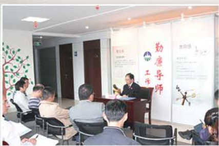
● 第四中学校长为师生宣讲“仁义礼智信”主题廉洁文化