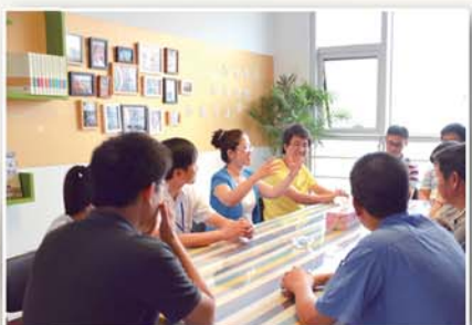
● 邀请勤廉导师开展自我成长团体辅导