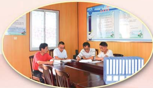
● 丁堰街道设立农村廉政风险防控室，确保村务监督有阵地