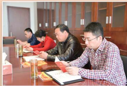
● 区纪委、监察局机关开展“重温党章、牢记使命”学习讨论活动