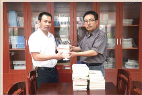
● 区纪委、监察局机关积极开展党员义工“365”活动，为结对社区捐建廉政图书角