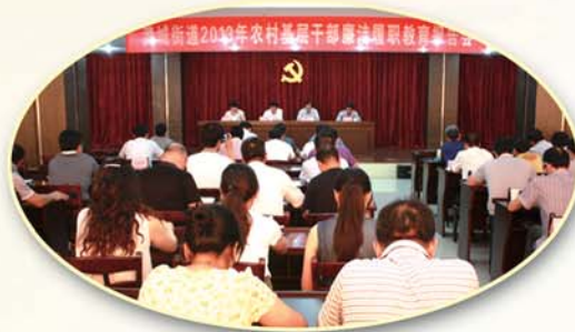
● 开展农村基层干部廉洁履职教育，增强廉政风险管控意识