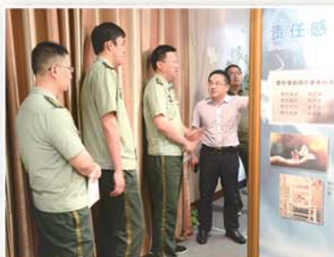
● 消防官兵到勤廉导师工作室开展主题教育