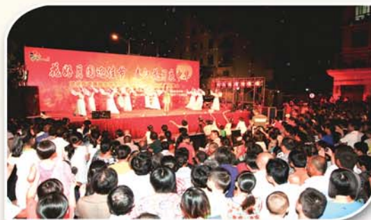
● 举办廉政文化进农村专场演出