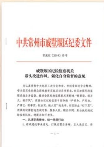
● 加强自身建设，锤炼过硬队伍

戚墅堰区纪委、监察局坚持高标准、严要求开展党的群众路线教育实践活动，确保“规定动作”做到位、“自选动作”显特色，用铁的纪律打造忠诚可靠、服务人民、刚正不阿、秉公执纪的纪检监察队伍。与此同时，积极履行党内监督专门机关职能，协助区委制定出台《关于加强监督检查推动改进作风常态化的实施意见》，以监督检查的制度化、规范化助推作风建设的常态化、长效化。