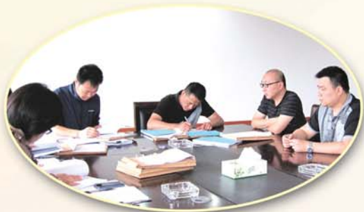
● 潞城街道出台并严格执行村级公有资金投资工程管理办法