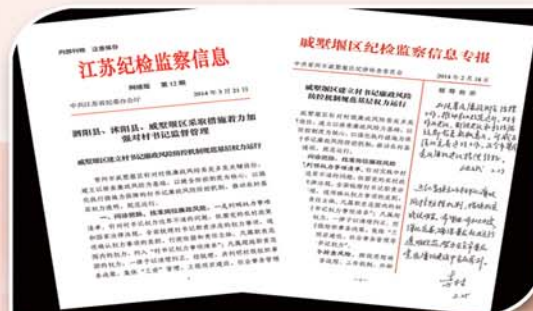
● 监督执纪问责，坚决纠正“四风”