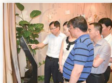
● 党员干部在勤廉导师工作室进行“心理体检”