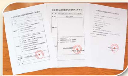
● 推行村书记廉政风险防控报告制度，实施全程留痕监控