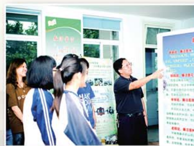
● 党风廉政辅导员在国土分局作预防腐败讲座