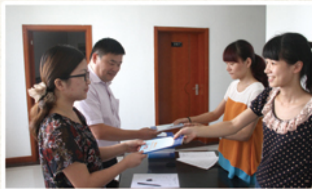
「两本手册」导航引领