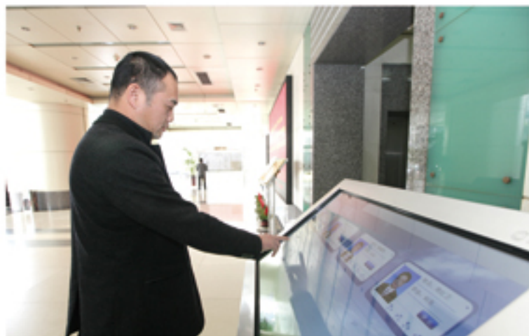
● 在集中办公场所运用机关作风效能满意度评价系统