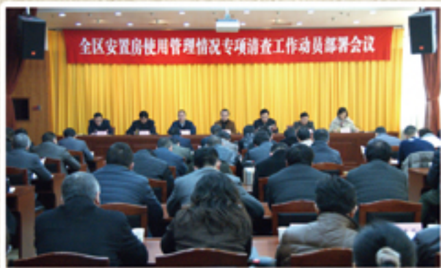
● 召开全区安置房使用管理情况专项清查工作动员部署会议