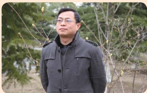
日前,2013年度首届“清风扬帆”网十佳作品、十佳通讯员、江苏反腐倡廉十大新闻评选结果公布。常州市纪委宣教室谭剑撰写的《常州:廉政文化“云”卷“云”舒》入选2013年度首届“清风扬