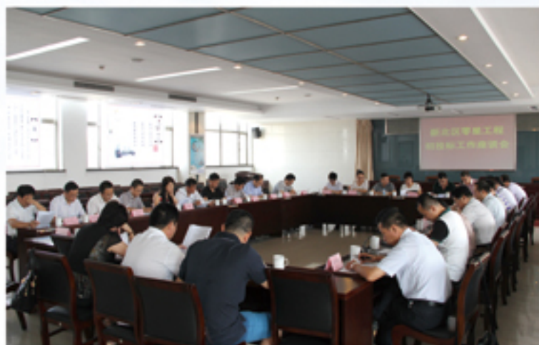
● 召开零星工程招投标工作座谈会