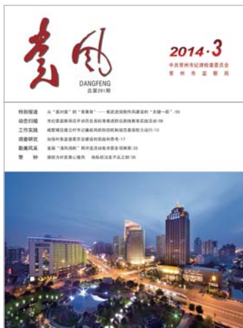
封面图片：汉江路夜景