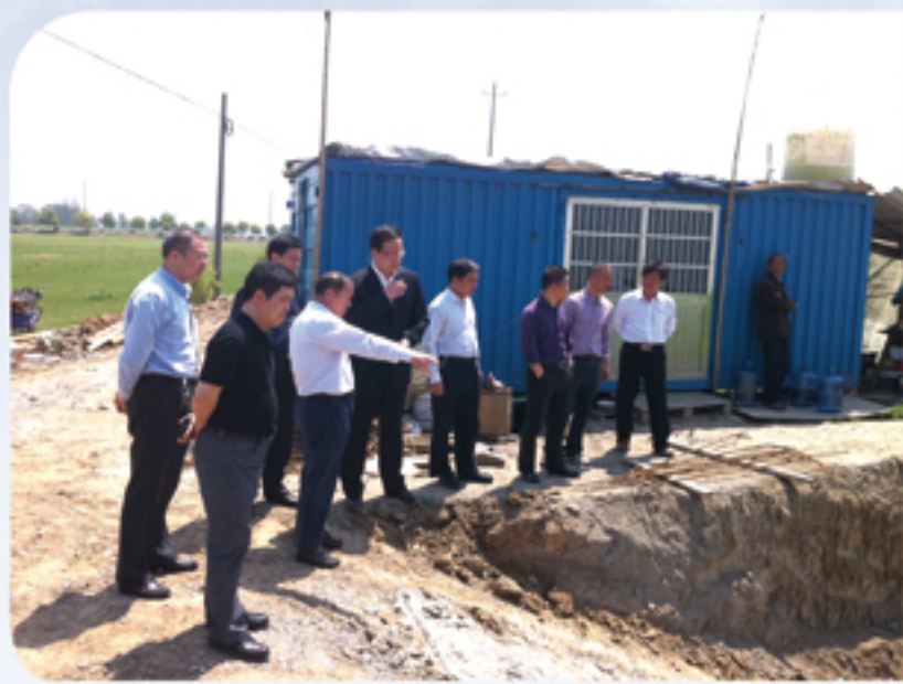
● 督查中央财政小型农田水利重点县项目

常州高新区坚持执法监察、效能监察、廉政监察“三位一体”，有力推动依法行政、高效施政、廉洁从政。转职能突出主业，做大执法监察影响。开展经济发展、科技创新、城乡建设等督查10次，发现问题28个，提出意见和建议32条，编制《督查专报》6期。转方式履行主职，做强效能监察质量。组织开展“攻坚现代化，誓争第一流”机关作风建设主题活动，以提速增效、新风正能、护航督查三大行动为载体，进一步提振党员干部干事创业精气神。转作风当好主力，做优廉政监察监督。强化对公款吃喝、公务用车、公款旅游、公款出境、大操大办婚丧喜庆事宜、节日期间廉洁自律等问题的监督检查。