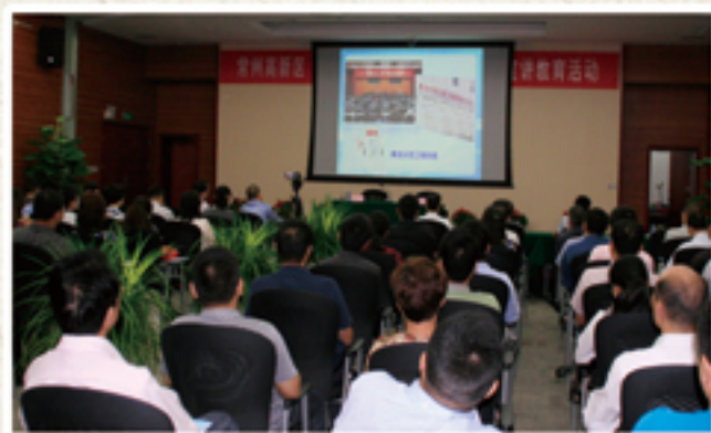
「两部片子」发人深省