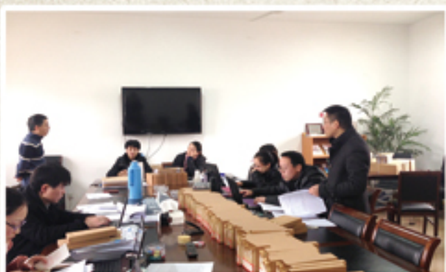
● 在薛家镇开展审计整改联合督查工作