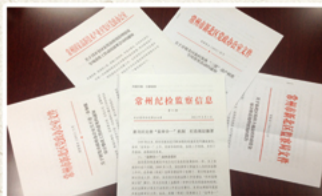
● “监审合一”工作相关文件制度

常州高新区创新“监审合一”工作机制，将监察和审计合二为一，在区级层面成立农村监察审计室，在各镇（街道）统一成立监察审计室，进一步强化对权力运行的监督和制约，既“管人”，又“理事”，形成了覆盖事前、事中、事后全过程的监督管理完整链条。每年确定1-2项重点项目，集中开展监察审计工作。2012年，开展了农村“三资”清产核资专项检查；2013年，开展了农村“三资”清产核资“回头看”活动；今年，正在开展全区安置房使用管理情况专项检查。近年来，该区通过“监审合一”已发现管理不规范资金4413万元，提出意见和建议181条，健全完善制度23项，立案查处党员干部6人，其中，移送司法机关处理5人。