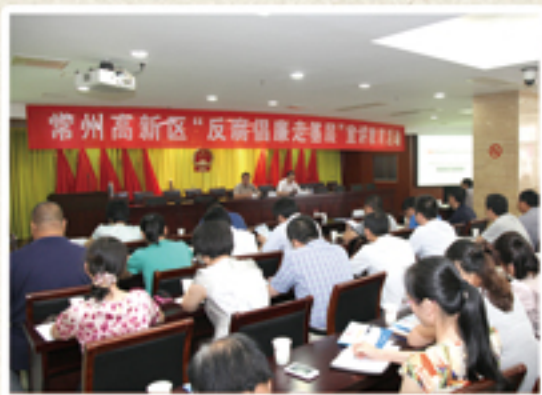
“十一场活动”紧锣密鼓

2013年常州高新区在全区6个镇、3个街道、2家国有企业全面开展“反腐倡廉走基层”系列宣讲教育活动，宣讲团成员由区纪委监委组成，活动主要面向全区各镇、街道村（社区）主要干部、事业单位负责人和国有企业管理岗位干部，教育党员干部达1500余人，力求实现最面广、最亲民、最深刻的党风廉政宣传教育效果，为推动高新区走在苏南现代化示范区建设前列营造良好的氛围。