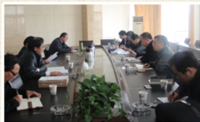
● 农机购置补贴专项资金监察审计，监审组在春江镇听取汇报