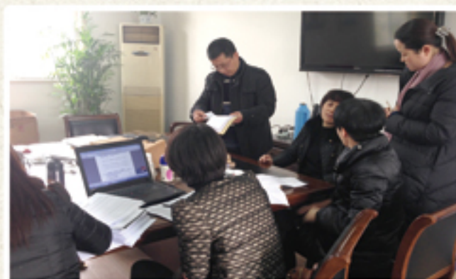
● 审计整改联合督查期间，工作组成员向有关工作人员询问情况