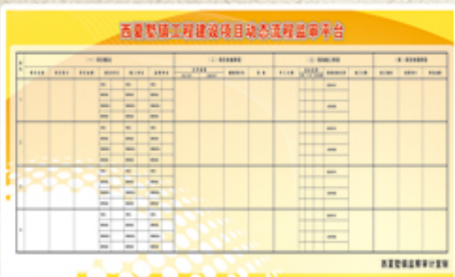
● 西夏墅镇建立工程建设项目动态流程监审平台