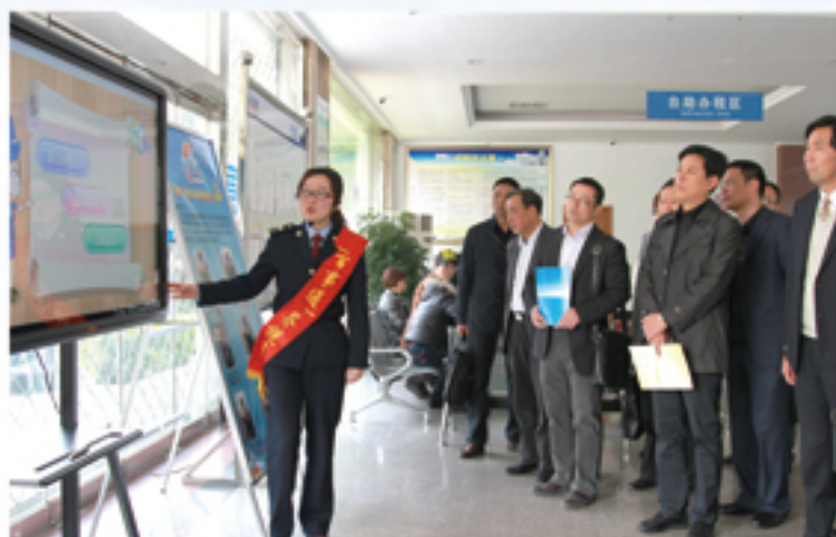
● 效能监测员参观区国税局“百事通”服务品牌创建