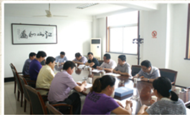
● 区农村集体“三资”清产核资专项督查，督查小组在西夏墅镇听取工作开展情况汇报