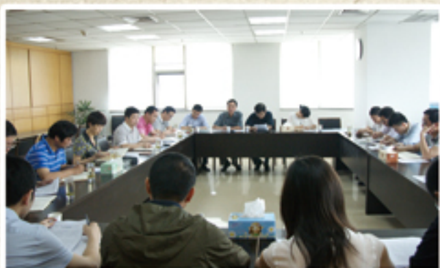
● 召开全区村（社区）集体“三资”清产核资专项督查“回头看”工作会议