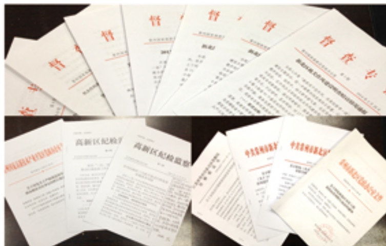
● 行政监察相关文件材料