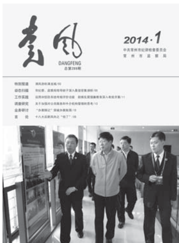
封面图片：省人民检察院检察长徐安到钟楼检察院视察指导工作