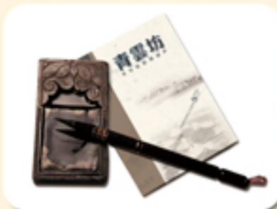
创办检察内刊《青云坊》