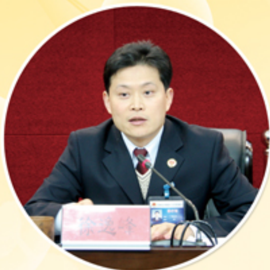
检察长徐逸峰上党课

近年来，钟楼区人民检察院始终将党风廉政教育和自身反腐倡廉建设作为长效工程常抓不懈，丰富载体阵地、筑牢廉政防线。坚持以制度管人管事，通过教育促廉、机制管廉、督察保廉，力戒“慵懒散”，昂扬“精气神”，全力营造风清气正的良好氛围。