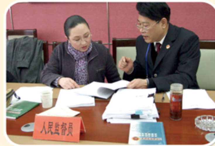
邀请人民监督员参加案件质量检查