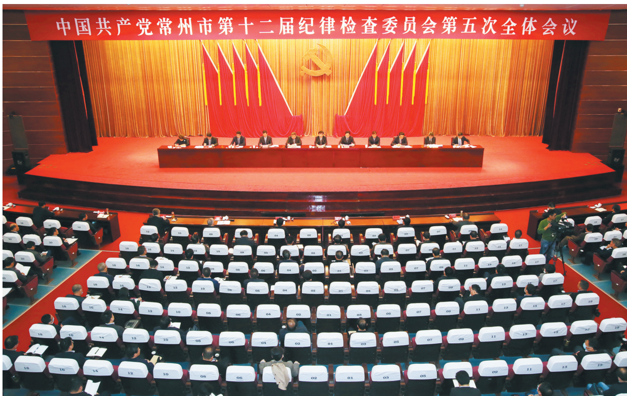
中国共产党常州市第十二届纪律检查委员会第五次全体会议

一要做深做实政治监督。坚持把“两个维护”作为政治监督的根本任务,推动党的重大政治原则、政治部署、政治责任落到实处。加大对各级党组织和党员干部学习贯彻习近平新时代中国特色社会主义思想的监督检查,紧紧围绕贯彻新发展理念、打赢“三大攻坚战”、推动长三角区域一体化、安全生产专项整治等