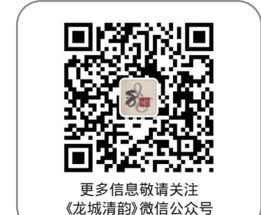
更多信息敬请关注 《龙城清韵》微信公众号