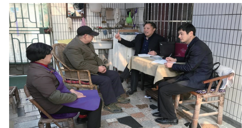
近日，常州市武进区湖塘镇纪委成立专项督查小组，对节前纪律作风建设情况进行督查。督查小组采取不打招呼、走村入户等方式，开展纪律作风专项督查。

巡察监督标本兼治。率先出台巡察整改工作问责办法，积极推行巡察情况“双反馈”、整改情况“双报告”机制，组织开展巡察整改专项督查，有效发挥巡察标本兼治作用。